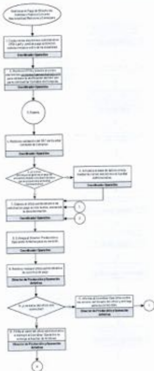
Diagrama de Flujo del Procedimiento para Gestionar el Pago de Directores, Solistas y Músicos Extra de Nacionalidad Mexicana y Extranjera